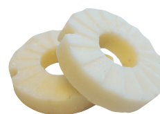
Pain solide de lavage des mains