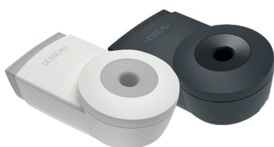
Distributeur automatique de pain de lavage solide blanc ou noir