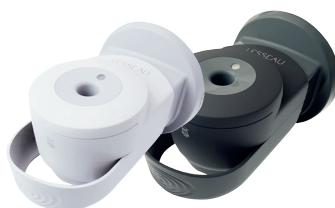
Distributeur manuel de pain de lavage solide blanc ou noir